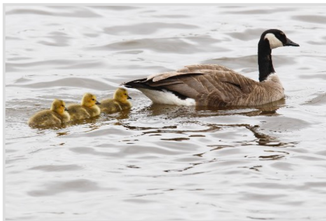
Bernache du Canada