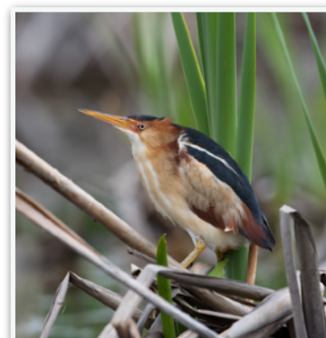
Petit Blongios

IMPORTANT : Les guides demandent d'être prévenus si vous êtes intéressé(e)s à participer à leur sortie , question d'organisation et de planification. Dans le cas où cela vous serait impossible de le faire à temps, le/la responsable vous accueillera avec plaisir si vous vous présentez à l'heure convenue. Lisez bien les instructions associées à chaque activité. Comment s'habiller, quoi apporter ? Quoi faire ? Vérifier les tarifs de covoiturage. Consultez notre Protocole des sorties et Code de conduite .