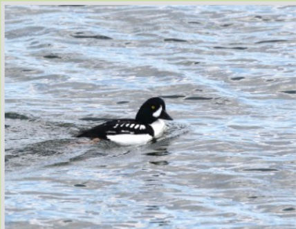
Garrot d'Islande

Le RécréoParc est un parc naturel situé devant les rapides de Lachine, en face de l'île aux Hérons. Au moins 70 espèces d'oiseaux fréquentant l'endroit en janvier, bonne façon de démarrer sa liste d'observation 2026! Selon la disposition des glaces et de l'eau libre, possibilité d'une vingtaine d'espèces de canards, jusqu'à cinq espèces de goélands, des rapaces et une quarantaine d'espèces de passereaux.